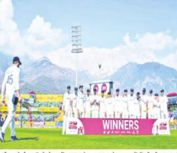
दौरान दो मैच ड्रां रहे थे। वहीं 1940 के दशक में ये रिकॉर्ड 0-11 का हुआ। भारत को टेस्ट क्रिकेट में पहली जीत 1950 के दशक में मिली थी। भारत ने 1952 में अपने 24वें टेस्ट में इंग्लैंड को हराकर पहला टेस्ट जीता था। इस दशक में भारत के हाथ कुल 6 जीत लगी थी।

नई दिल्ली: भारत ने इंग्लैंड को धर्मशाला में खेले गए सीरीज के 5वें और अखिरी टेस्ट में पारी और 64 रनों से रौंदकर कई बड़े रिकॉर्ड्स बनाए। इनमें से एक रिकॉर्ड ऐसा है जो भारतीय टेस्ट क्रिकेट के इतिहास में टीम इंडिया के नाम पहली बार जुड़ा है। टेस्ट क्रिकेट में ऐसा पहली बार हुआ है जब टीम इंडिया का विन/लॉस रिकॉर्ड 1 का हुआ है। इसका मतलब है कि टीम इंडिया ने टेस्ट क्रिकेट में जीतने मैच हारे हैं उतने ही जीते भी हैं। 92 साल के भारत के टेस्ट क्रिकेट के इतिहास में ऐसा पहली बार हुआ है। टीम इंडिया ने 1932 में अपना पहला टेस्ट मैच खेला था। पिछले 92 सालों में भारत ने कुल 579 मैच खेले हैं जिसमें 178 मैच उन्होंने जीते हैं वही इनमें ही मैच उन्होंने हारे हैं। इस दौरान टीम इंडिया ने 222 मैच ड्रां खेले हैं वही एक मैच टाई भी रहा है। बात टीम इंडिया के हर दशक के विन/लॉस रिकॉर्ड की करें तो, 1930 के दशक में भारत ने 7 में से 5 मुकाबले जीतए थे, वहीं इस