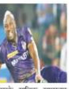
35 वर्षीय रसेल का वीडियो केकेआर ने अपने इंस्टाग्राम अकाउंट पर शेयर किया है। केकेआर ने कैप्शन में लिखा, गौरतलब है कि आईपीएल के आगामी सीजन का आंजाज 22 मार्च से होगा। केकेआर दुर्नामेंट में अपने अभियान की शुरुआती 23 मार्च को करेगी। केकेआर को पहला मैच इंडन गार्डन स्टेडियम में सनराइजर्स हैदराबाद (एसआरएच) के विरुद्ध खेलना है। रसेल 2014 में पहली बार केकेआर के लिए खेले थे। वह तब से फेंचाइजी के अहम खिलाड़ी हैं। वह हाल ही में बांग्लादेश प्रीमियर लीग (बीपीएल) में मैदान पर उतरे, जहाँ उनकी टीम कोईमिला विकेटोरियन को फाइनल में फर्च्युन बरिशाल के हाथों हार डेलनी पड़ी।

नई दिल्ली: वेस्टइंडीज के धाकड़ ऑलराउंडर आंद्रे रसेल जल्द ही आईपीएल 2024 में धमाल मचाते हुए नजर आएंगे। वह 17वें सीजन से पहले लुट पुट गए हैं। दरअसल, रसेल बॉलिवुड साॅन लुट पुट गया गाने पर झूमते दिखे। उनका वीडियो सोशल मीडिया पर जम्कर वायरल हो रहा है। यह गाना शाहरुख खान की फिल्म उन्की का है, जो पिछले साल रिलीज हुई थी। रसेल आईपीएल में कोलकाता नाइट राइडर्स (केकेआर) फेंचाइजी का हिस्सा हैं, जिसके मालिक सुपरस्टार शाहरुख हैं।