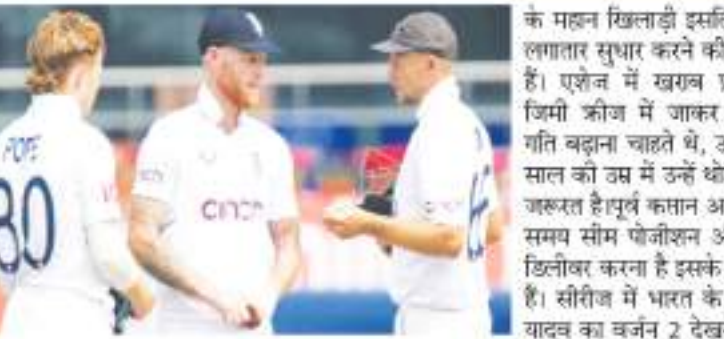
के महान खिलाड़ी इसलिए हैं क्योंकि वे लगातार सुधार करने की कोशिश कर रहे हैं। एशेज में खराब प्रदर्शन के बाद, जिमी क्रीज में जाकर अपनी रन-अप गति बढ़ाना चाहते थे, उन्हें लगा कि 41 साल की उम्र में उन्हें थोड़ी और तेजी की जरूरत है। पूर्व कप्तान आगे लिखते हैं, हर समय सीम पीरोशन और गेंद को कैसे छिलीकर करना है इसके बारे में सीख रहे हैं। सीरीज में भारत के स्पिनर कुलदीप यादव का वर्जन 2 देखने को मिला। वह संस्करण यन से बहुत बेहतर है क्योंकि उसने इसमें सुधार करने की कोशिश की है। हुसैन ने इंग्लैंड के बल्लेबाजों की जम्कर क्लास ली। अच्छी शुरुआत मिलने के बावजूद जॉर्ली सीरीज में एक भी शतक नहीं जड़ पाए। जबकि बेन डेविस ने नई गेंद पर खराब शॉट खेलें, ऑली पोप ने पहले टेस्ट में 196 रनों की पारी खेलने के अलावा पूरे टेस्ट में कुछ नहीं किया।

नई दिल्ली: एजेंसी नासिर हुसैन ने इंग्लैंड को 1-4 से भारत में सीरीज हारने के बाद जम्कर लगाई लगाई है। पूर्व कप्तान का मानना है कि इंग्लैंड बैजवॉल शब्द में इतना खो गया कि वह पूरी सीरीज के दौरान आम-सुधार ही नहीं कर पाया। इंग्लिश टीम ने हैदराबाद टेस्ट जीतकर जरूर सीरीज का अंजाज जोरदार अंजाज में किया था, मगर इसके बाद मेहमानों को लगातार चार मुकाबलों में हार का सामना करना पड़ा। चारों मुकाबलों में इंग्लैंड की गलतियाँ लगाभा एक जैसी थीं। ओपनिंग टीम को अच्छी शुरुआत देते, मगर मिडिल ऑर्डर का साथ ना मिलने की वजह से टीम ताश के पत्तों की तरह ढल जाती। वहीं स्पिनर्स विकेट तो चटकते, मगर रन वह जरूरत से ज्यादा खर्च करते। इन सभी मुद्दों पर नासिर हुसैन ने अपनी टीम को लताड़ लगाई है।