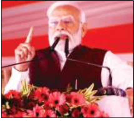
प्रधानमंत्री नरेन्द्र मोदी ने आजमगढ़ में जनता को संबोधित करते हुए।